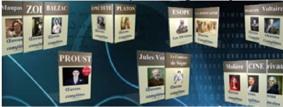
Plate-forme de référence des éditions numériques des oeuvres classiques en langue française

Retrouvez toutes nos publications, actualités et offres privilégiées sur notre site Internet www.arvensa.com