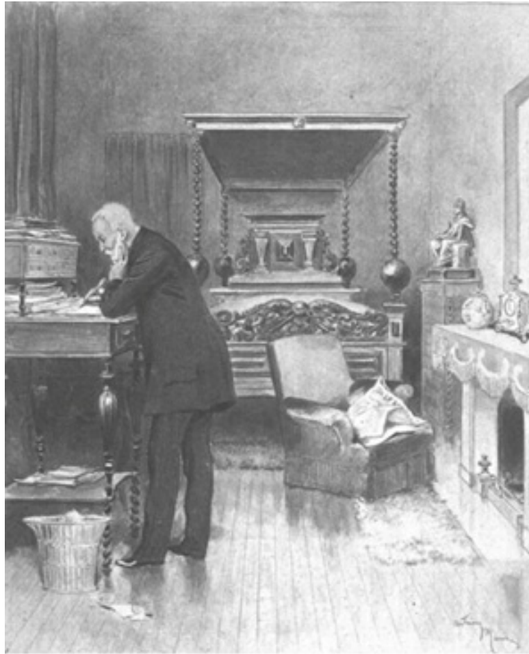
Victor Hugo à sa table de travail